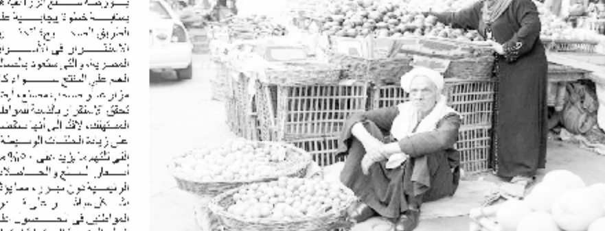
أحد بائعي الخضار بالأسواق المصرية

لا تزال البورصة السلعية المصرية تتأرجح بين جذب الاستثمار وبين ضبط الأسعار، وذلك من أجل تعزيز السياحة في الإسكندرية، وذلك بالتعاون والتنسيق مع إدارة مطارات الإسكندرية، وذلك خلال ستة أشهر بتكلفة منخفضة، وذلك بالتعاون والتنسيق مع إدارة مطارات الإسكندرية.