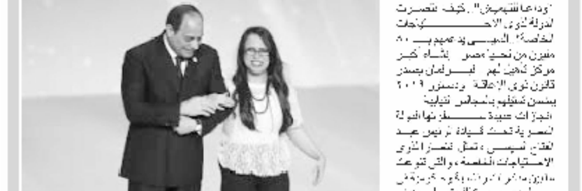
إهتمام خاص من الرئيس السيسي بذوى الاحتياجات

كيف انتصرت الدولة لذوى الاحتياجات الخاصة؟