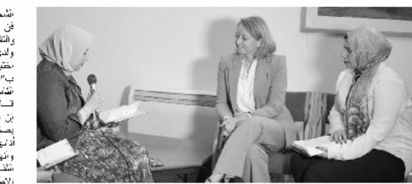
د. كاريتا رئيس جامعة تمبرا فى لقاء حواريا مع طلبة معهد الإعلام

أشخصية فالطلاب يتعلمون فى دائرة ويتممون فى الحضور الذى يركز على مهارات التواصل والتفكير الناقد ومهارات حل المشكلات... www.alexnews.com