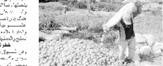
شراء من أثناء جنى الفلفل

وقال المحافظ على أهمية هذا الخط الجوي، وذلك من أجل تعزيز السياحة في الإسكندرية، وذلك بالتعاون والتنسيق مع إدارة مطارات الإسكندرية، وذلك خلال ستة أشهر بتكلفة منخفضة، وذلك بالتعاون والتنسيق مع إدارة مطارات الإسكندرية.