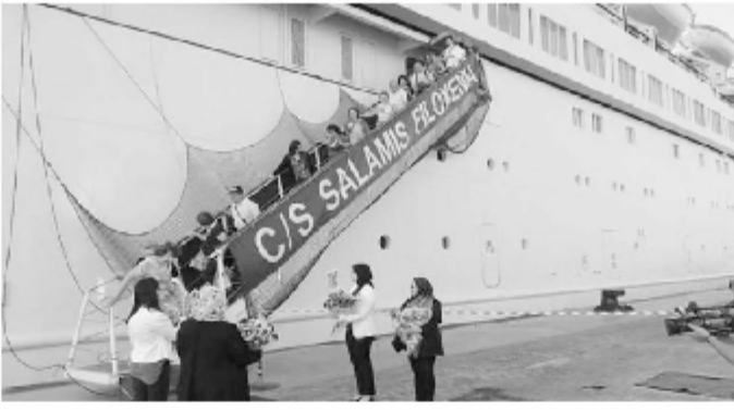
تظاهرة وصول سفينة مدينة الإسكندرية