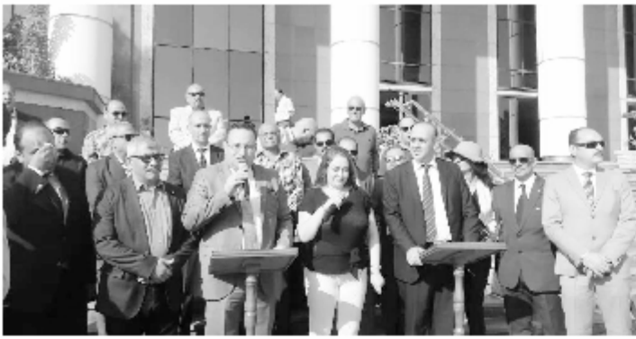
كلية محافظ الإسكندرية خلال الترحيب