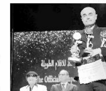
إعلان جوائز المسابقة الرسمية للإفلام الوطنية

وخلال استضافة حفل افتتاح المهرجان في الإسكندرية حضره الرئيس عبد الفتاح السيسي، مع عدد من كبار المسؤولين، وقد تم تكريم عدد من الفنانين والفنانات الذين شاركوا في المهرجان. وقد تم تكريم الفنانة نبيلة عبيد والفنان أيمن زيدان، إضافة إلى عدد من الفنانين الشباب الذين شاركوا في المهرجان.