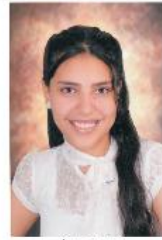
هانيم قرريب أنيب